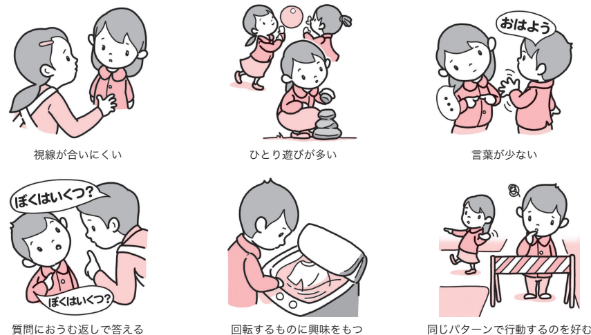
図 8-2 発達障害の行動の特徴 (例)

言葉や身振り、表情などを使って自分の気持ちを伝えることが苦手であり、相手の言葉や表情から感情や状況を理解することもむずかしい。あいまいな指示や抽象的な表現は理解しづらく、写真や絵、文字などの視覚的情報のほうが理解しやすい。